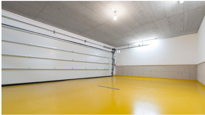
Ideal für Garagen

Aqua Sealing AS 1500 ist eine wasseremulgierte Epoxidharz-Versiegelung, die leicht beanspruchte Betonböden im Außen- und Innenbereich z. B. in Werkstätten, Garagen, Lagerräumen, Labors, Kellern, Verkaufs- oder Ausstellungsflächen optimal schützt. Aufgrund ihrer Diffusionsfähigkeit ist sie auch auf kritischen Untergründen wie Calciumsulfat- und Magnesiaestrichen einsetzbar. Ebenso eignet sie sich hervorragend für die einfache und rasche Renovierung von alten, funktionsfähigen, keramischen Flächen. Die AS 1500 ist in über 100 RAL-Farbtönen erhältlich und ermöglicht unzählige Gestaltungsmöglichkeiten. Die Versiegelung lässt sich leicht reinigen, einfach pflegen und schützt z. B. den Garagenboden vor Öl und Streusalz. Die AS 1500 ist geruchsarm, frei von migrationsfähigen Bestandteilen und in wiederverschließbaren Gebinden erhältlich.