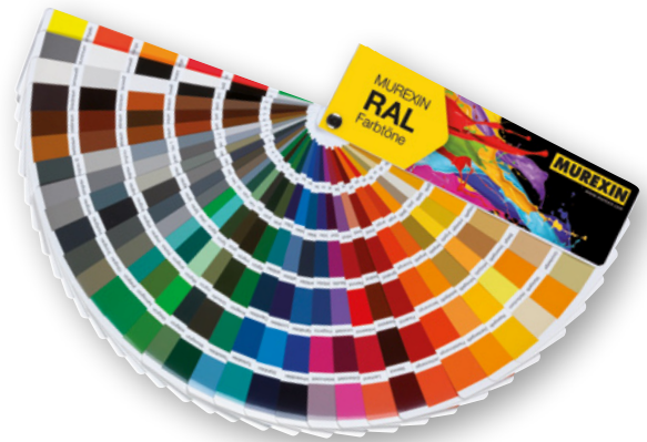
Vielfältige Designmöglichkeiten - mit 100 RAL Tönen