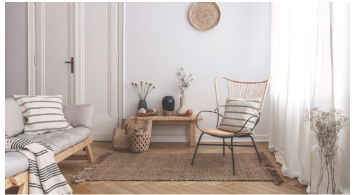
Universell einsetzbar mit geringem Verbrauch