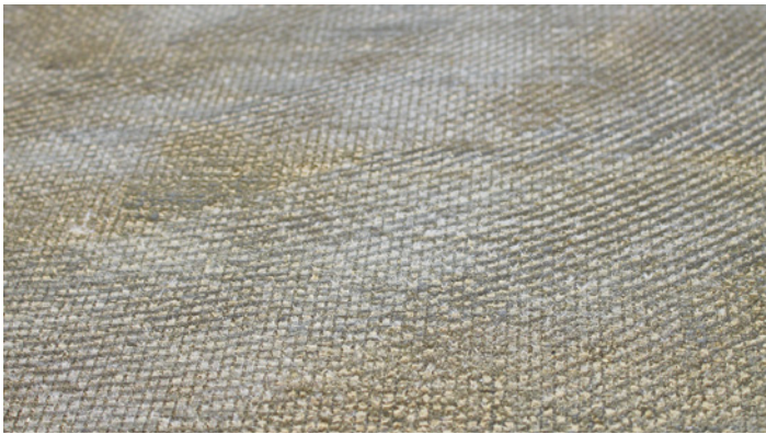
Ideal als Haftbrücke selbst bei wasserbeständigen, fest haftenden Klebstoffresten