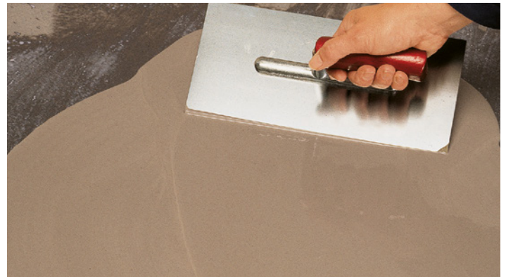
Pumpfähig, selbstnivellierend, fließfähig mit extrem guten Verlauf