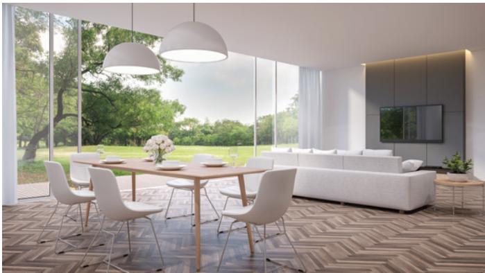
Planebene Unterböden als Basis für die Bodenverlegung