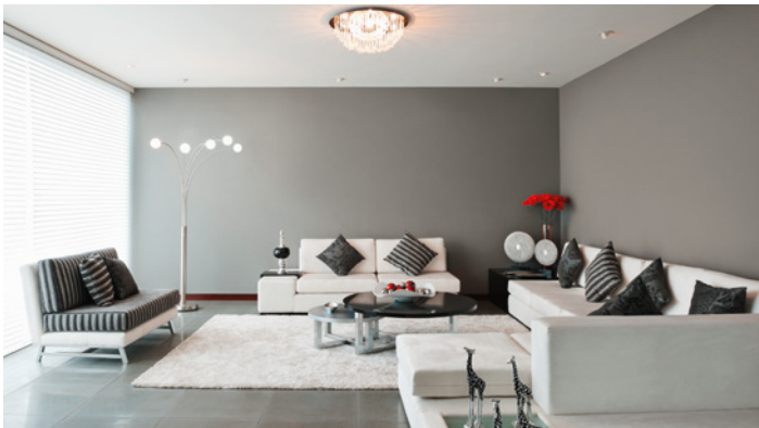
Ideal für zur Vorbereitung aller Arten von Bodenverlegungen