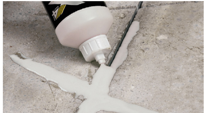
Zum Verschließen von schmalen und breiten Estrichrissen